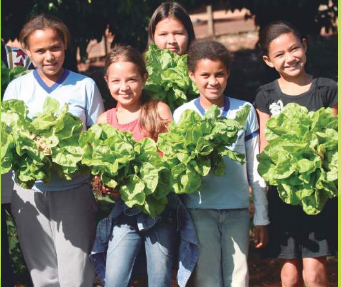
Escola João Saraiva, em Santa Helena de Goiás (GO), junho de 2009